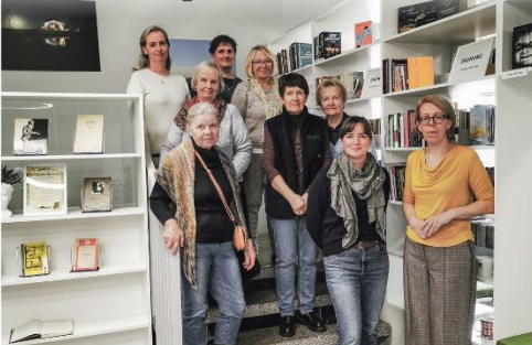
Ogresgala pagasta Ciemupes bibliotēkas lasītāju klubīņam «Dālies priekš» šogad aprit trīs gadi. Reti mēnisi sanāk kopā tie, kam grāmatas ir labāko draugu pulkā, lai pārņemtu lasīto un tiktos ar domubiedriem. Klubīņam Ciemupē ir dzīlākas saknes, jo tas darbojas arī iepriekš.