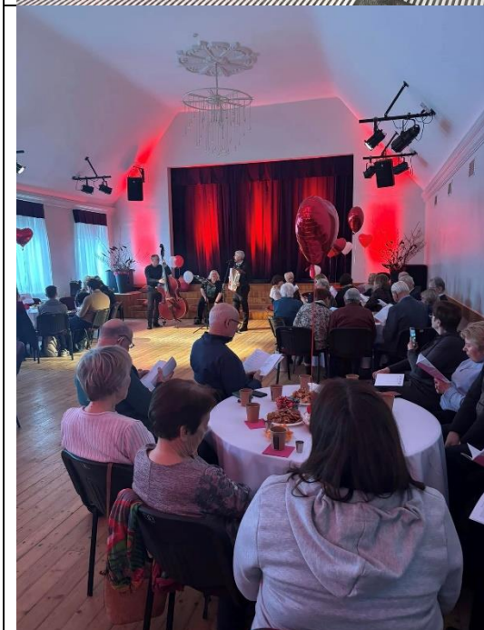
Paaudžu sadziedāšanās svētki “Ar mīlestības pinekļiem” 14. februārī (sadarbībā ar Ikšķiles Tautas namu, Ikšķiles vidusskolu, Ikšķiles Senioru skolu)