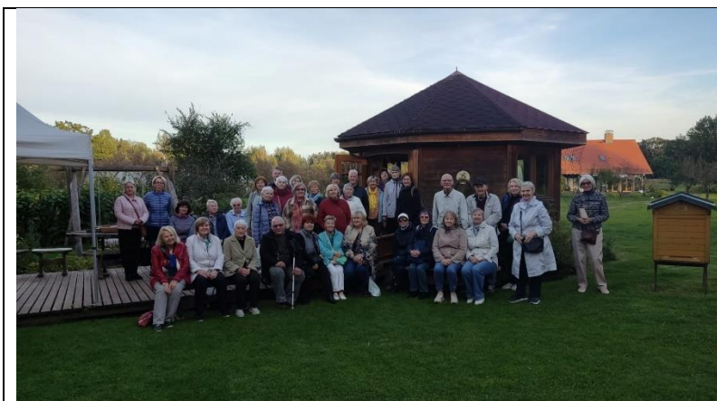
Lasītāju kluba ekskursija uz Pierīgu u.c. vietām.