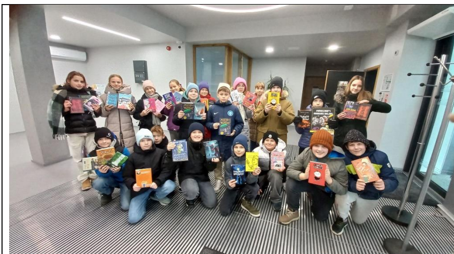
Ekskursijas bibliotēkā Ikšķiles vidusskolas klasēm.