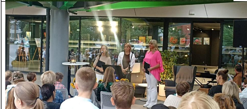
Dzejas dienas IPB sadarbībā ar Ikšķiles vidusskolu.