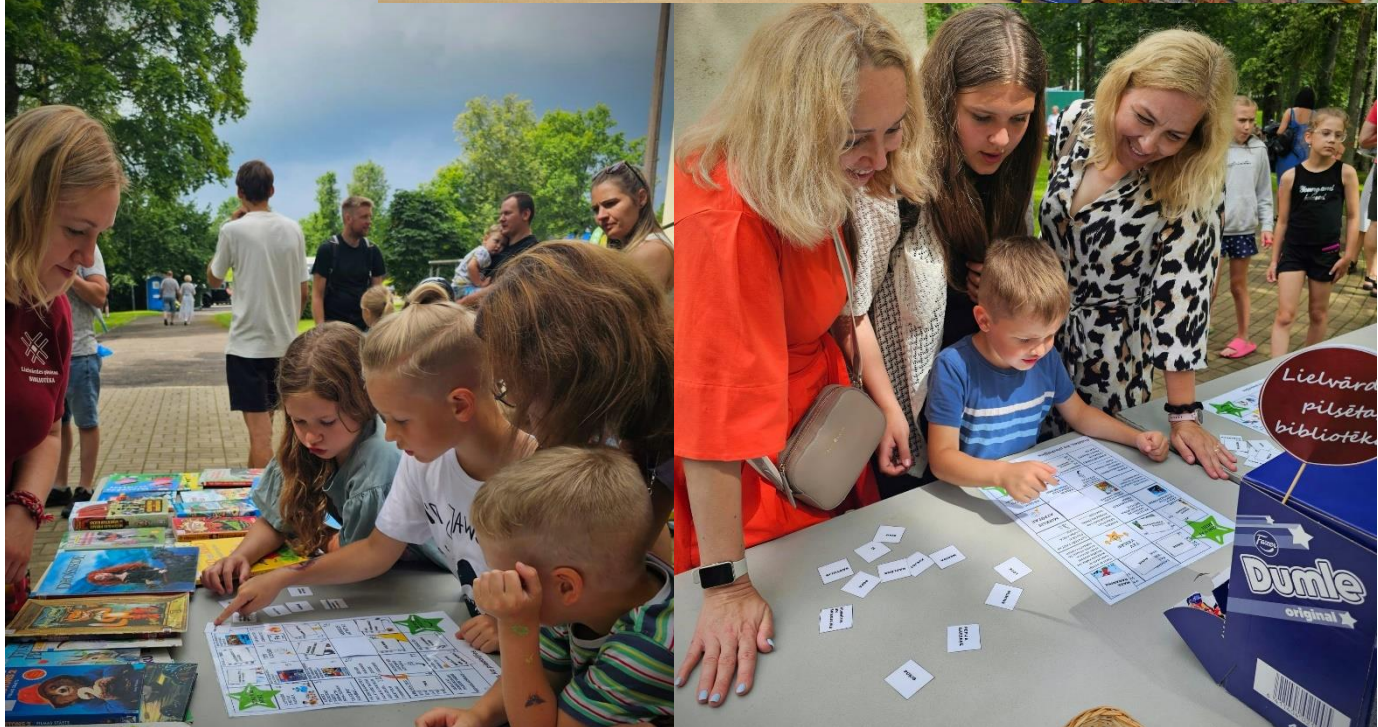
“Latviešu grāmatai 500”