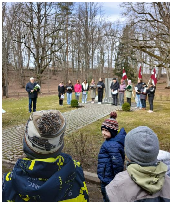
25. marts – Komunistiskā genocīda upuru piemiņas dienas pasākums pie Taurupes pieminekļa.