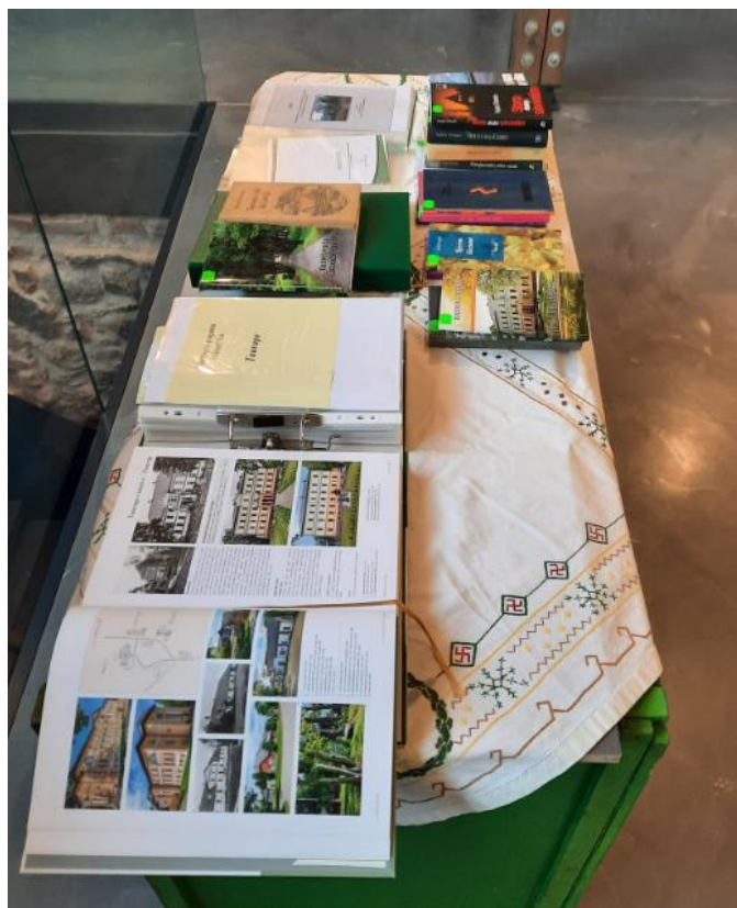
Pasākumā – “Ināru klubiņš” – novadpētniecības izstāde “Taurupē – viss kā Latvijā”.