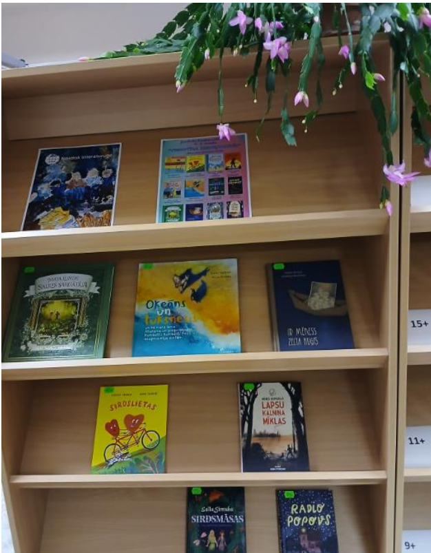
Ziemeļvalstu literatūras nedēļa bibliotēkā. Tēma – “Vienoti Ziemeļvalstīs”.