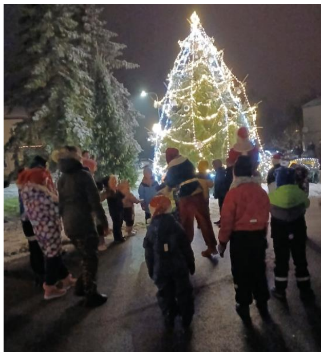
30. novembrī – Lielās egles iedegšana pie bibliotēkas.