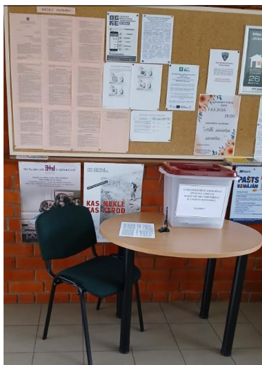
Iedzīvotāju aptauja – Ogres novada teritorijas plānojuma izstrādei no 17.02. – 18.03.