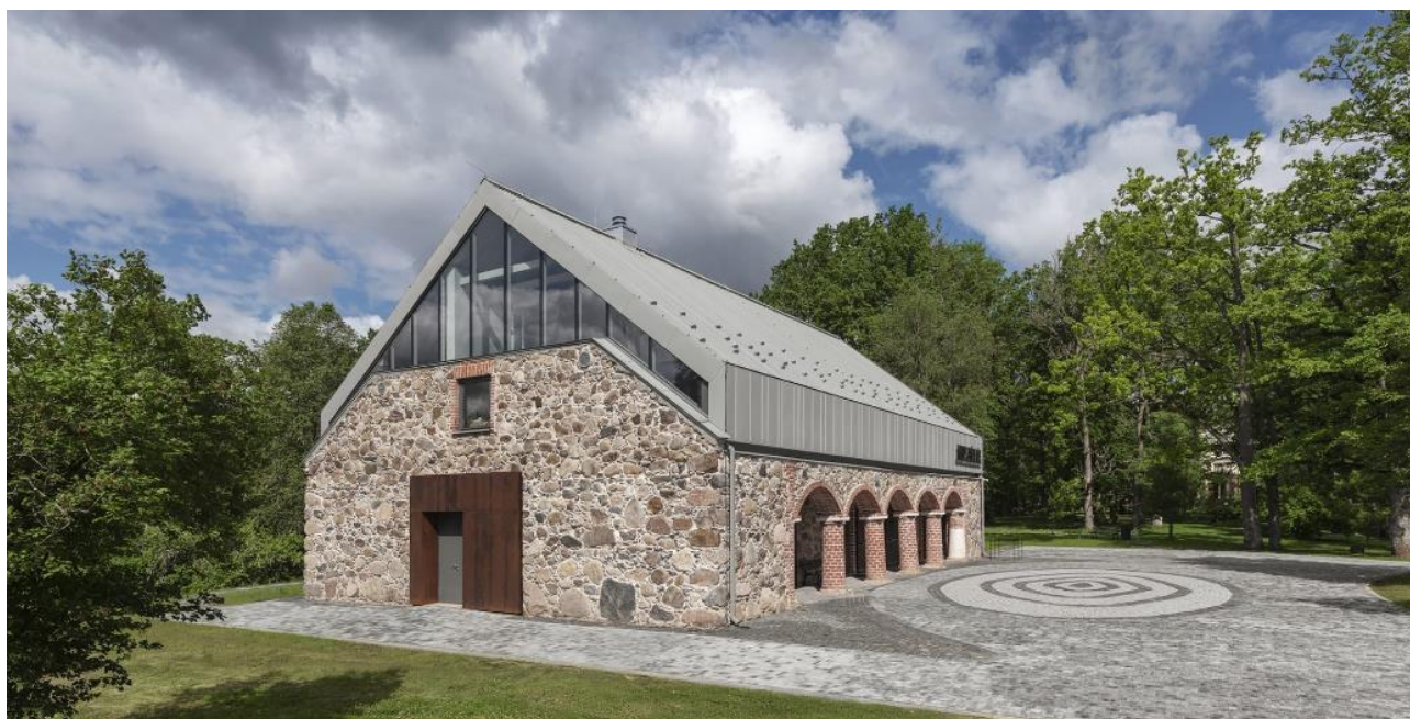
Taurupes muižas klēts atklāta – jauna kultūrtelpa Taurupē.